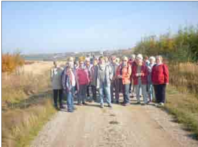
Rundwanderung Ronneburg - Neue Landschaft - Kauern - Ronneburg

Eine sehr schöne Rundwanderung erlebten wir im Oktober von Ronneburg durch die Neue Landschaft nach Kauern und zurück. (s. Foto)