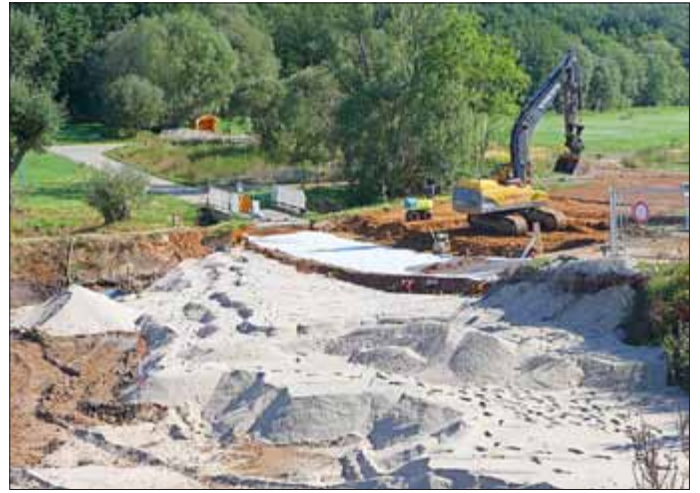
Aufbau der Flächendrängage aus gestuftem Kies (Schichten), Wiederherstellung der Straße und der Bodenschicht

Ziel der Maßnahmen ist es, alle kontaminierten Grundwässer im Zusammenhang mit der Grubenflutung zukünftig vollständig zu fassen. Um die Arbeiten durchzuführen, wurde der Flutungswasserstand abgesenkt, und zwar bereits soweit, dass das Gessental nun praktisch trocken liegt.