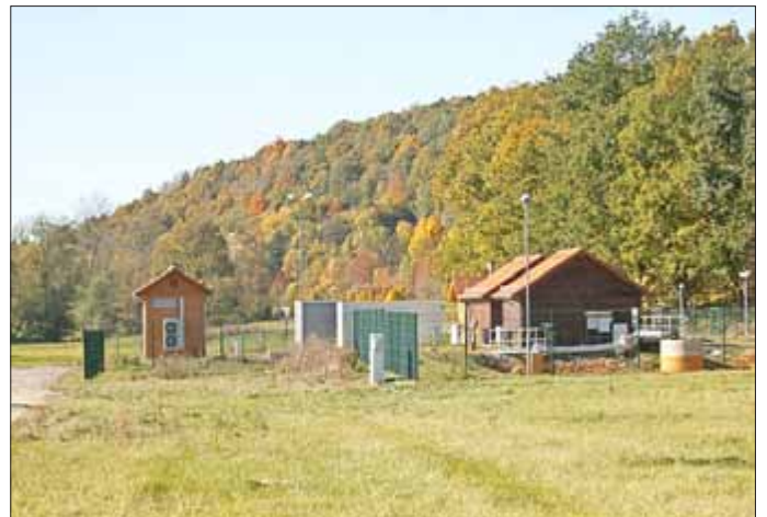
An der Pumpstation der Wismut GmbH im Gessental laufen die Baumaßnahmen zusammen

Für den sicheren Betrieb der Pumpenstation (Abbildung 2) wird der unterirdische Pumpenvorlagebehälter vergrößert. Diese Arbeiten beginnen voraussichtlich Ende 2016. Eine kleine Baustelle wird zeitweise unmittelbar östlich der Kläranlage Ronneburg eingerichtet. Hier finden derzeit bergtechnische Erkundungen im Bereich einer alten Bohrung statt, die später verwahrt werden soll.