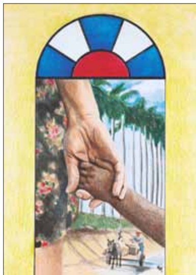
„Nehmt Kinder auf und nehmt mich auf“ Bild zum Weltgebetstag 2016 - Thema Kuba

16:00 Uhr Gottesdienst mit Vorstellung in der Konfirmanden in der Marienkirche Ronneburg