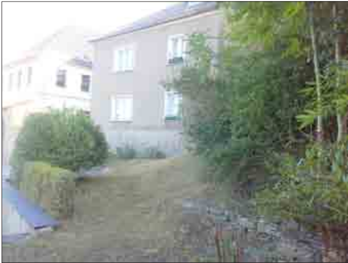
8. Reparatur Gehweg Robert-Schumann-Straße war notwendig, weil Baumwurzeln angrenzendes Grundstück sonst schädigen,