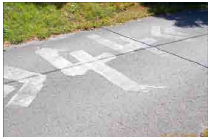
12. Straße in Grobsdorf beschmiert, Anzeige wurde erstattet,