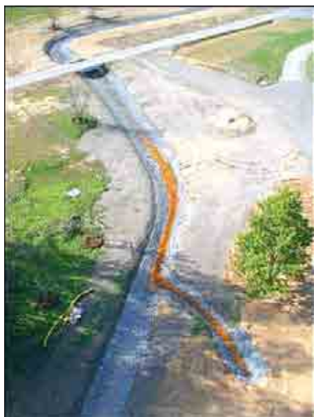
Blick von der Drachenschwanzbrücke auf den 2006 an den Badergraben angebundenen Wasseraustritt „Schwarzer Bär“ mit Eisenocker

In der Ausgabe 5/2016 des Ronneburger Anzeigers vom 03. März 2016 berichtete die Wismut GmbH an dieser Stelle über den Fortgang der Arbeiten zur Erweiterung der Wasserfassung im Gessental. Nun wird auch ein Wasseraustritt unmittelbar westlich neben der Drachenschwanzbrücke durch die Wismut bearbeitet.