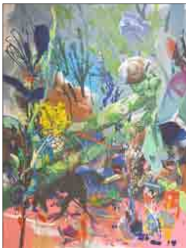
Jean-Xavier Renaud - Réchauffement climatique - Öl auf Leinwand 2015

Mit großer Freude zeigt die Galerie Dukan Leipzig die Ausstellung „Umweltverschmutzungen“ - „Pollutions atmosphériques“ von Jean-Xavier Renaud. Jean-Xavier Renaud wurde 1977 in Woippy in Lothringen geboren. Er studierte bis zu seinem Diplom an der Kunsthochschule Straßburg (École supérieure des arts décoratifs) und lehrt heute an der Hochschule für Kunst und Design in Genf (HEAD). Seit 2004, einem Schlüsseljahr im Leben des Künstlers, wohnt Jean-