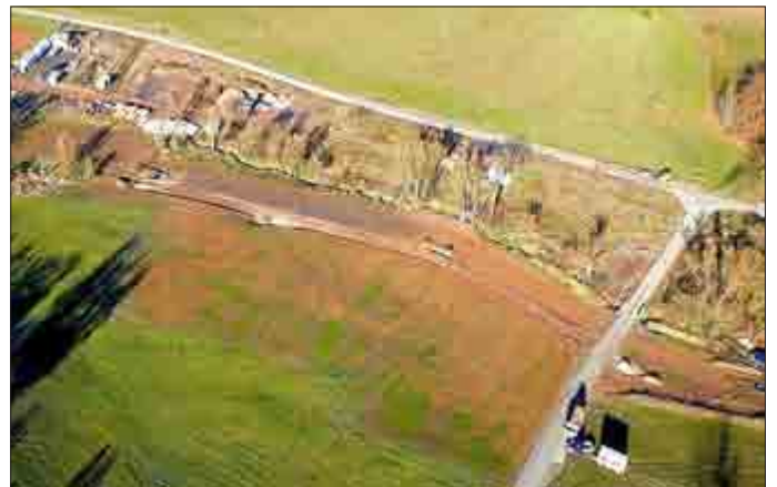
Abbildung 2: Die Versatzstelle im Gessental nach der Sanierung (unterirdische Verwahrung, Flächen- und Liniendränagen) Begrünung im November 2016

Bereits Mitte 2017 sind die Arbeiten soweit abgeschlossen, dass der Wiedereinstau des Flutungsraumes des Grubengebäudes Ronneburg beginnen kann. Dieser Zeitpunkt wird für eine 3- bis 4-monatige Abschaltung der Wasserbehandlungsanlage Ronneburg genutzt. Nach Dauerbetrieb unter Vollast seit 2006 ist hier eine Generalwartung und -intandsetzung notwendig. Der Flutungswasserstand kann nach einigen Wochen wieder das Niveau des Gessentales von ca. 235 m NN erreichen. Deshalb werden die technischen Anlagen zur Wasserfassung, Abförderung und Versturz (Einleitung von im Gessental gefasstem Grundwasser in den Flutungsraum der Grube Ronneburg) betriebsbereit gehalten und bei Bedarf betrieben. Somit ist stets gewährleistet, dass der Gessenbach nicht kontaminiert wird. Ab 2018 wird der weitere Flutungsverlauf bei einem Niveau um 247 m NN gesteuert werden. Dann kann auch die Sanierung (Reinigung, Wiederherstellung der Durchgängigkeit und Abdichtung) des derzeit streckenweise kontaminierten und für die Wasserhaltung benutzten Gessenbaches durchgeführt werden. Der Beginn dieser Arbeiten ist in diesem Jahr geplant.