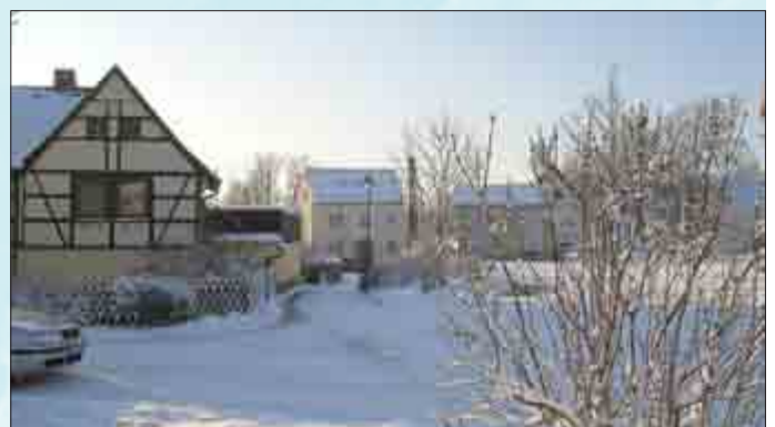
Winter in Raitzhain