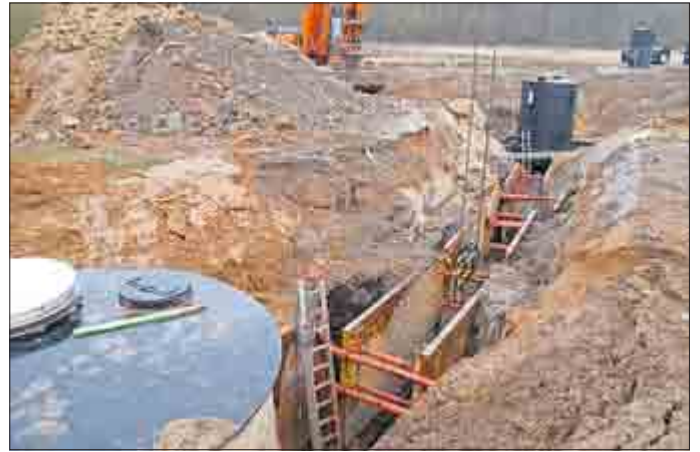
Abbildung 1: Herstellung einer Liniendränage zur Wasserfassung im Gessental zwischen zwei Funktionsschächten. Dazu gehören vor allem die Errichtung weiterer Liniendränagen im Bereich der Wegkreuzung mit dem Gessenbach (Schutzhütte), die Erweiterung des unterirdischen Pumpenvorlagebehälters unmittelbar an der Pumpstation und die Verwahrung einer Altbohrung durch großkalibriges Überbohren ca. 100 m westlich der Pumpstation. Deshalb wird es im Gessental noch bis Mitte 2017 2 bis 3 Baustellen gleichzeitig geben. Die neue Druckrohrleitung aus dem Gessental zur Wasserbehandlungsanlage ist bereits fertiggestellt.

In den Ausgaben 12/2015 und 05/2016 des Ronneburger Anzeigers berichtete die Wismut GmbH über die Arbeiten im Gessental bei Ronneburg. Ziel der Maßnahmen ist es, alle kontaminierten Grundwässer im Zusammenhang mit der Grubenflutung zukünftig vollständig zu fassen und die technischen Anlagen zur Abförderung entsprechend auszulagern. Um die Arbeiten durchzuführen, wurde der Flutungswasserstand von ca. 260 m NN bis unter das Gessentalniveau auf 230 m NN abgesenkt. Im ersten Halbjahr ist der Abschluss der teils großflächigen Bau- und Sanierungsarbeiten vorgesehen.