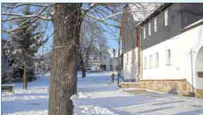
Winter in Grobsdorf