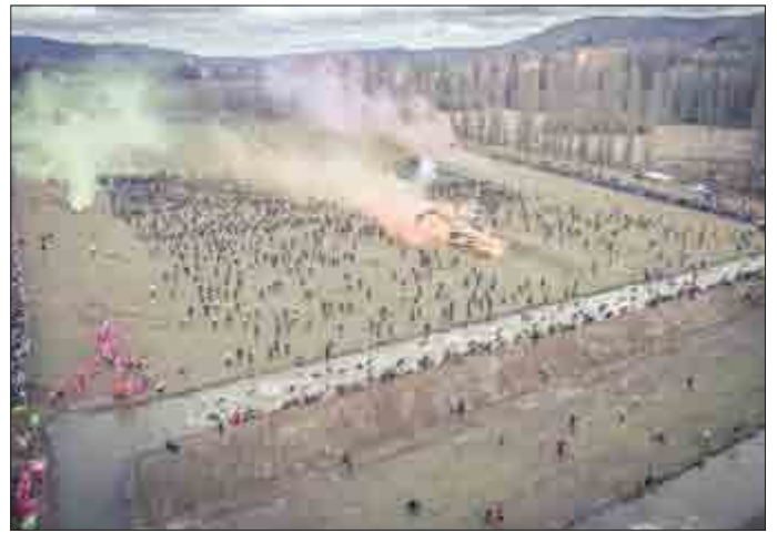
Start in die Wassergräben

Das Hindernislaufjahr 2018 des OCR-Team „Clan der Haldenländer“ fand seinen würdigen Abschluss im alljährlichen Start beim härtesten Hindernislauf Europas „Getting Tough The Race“ in Rudolstadt, am 08. Dezember 2018. 24 Kilometer Laufstrecke mit 950 Höhenmetern im Anstieg und über 100 Hindernisse warteten auf die knapp 3000 Starter. Bei 7 Grad Lufttemperatur und 4 Grad Wassertemperatur (dieses Mal waren die Hindernisse extrem wasserlastig), sowie einem extrem scharfen Wind und Regen kämpften sich alle Starter über die Strecke und Hindernisparcours.