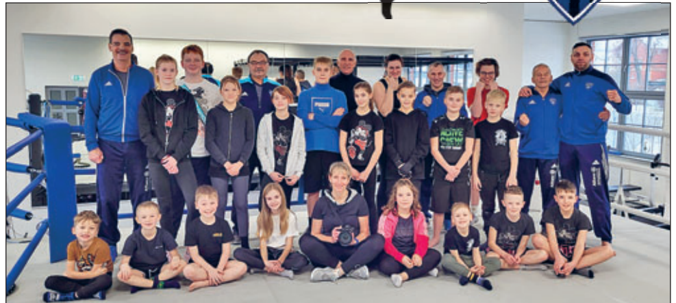
Kids und Übungsleiter im Rampenlicht

Das hört sich so einfach an, aber viele Faktoren spielen dabei eine gewichtige Rolle. Wenn es um die Präsentation der Abteilung mit seinen Sparten geht, sollten der „Ronneburger Anzeiger“ und die OTZ mehr genutzt werden. In „Bäumi“ hat man dabei einen guten Partner gefunden. Übrigens, bereits Tage vor der Gesprächsrunde ein erstes Achtungszeichen in Sachen Präsentation. Ein toller Nachmittag war für viele Kids nachhaltig, denn ein professionelles Fotoshooting sorgte für Abwechslung im Ver-