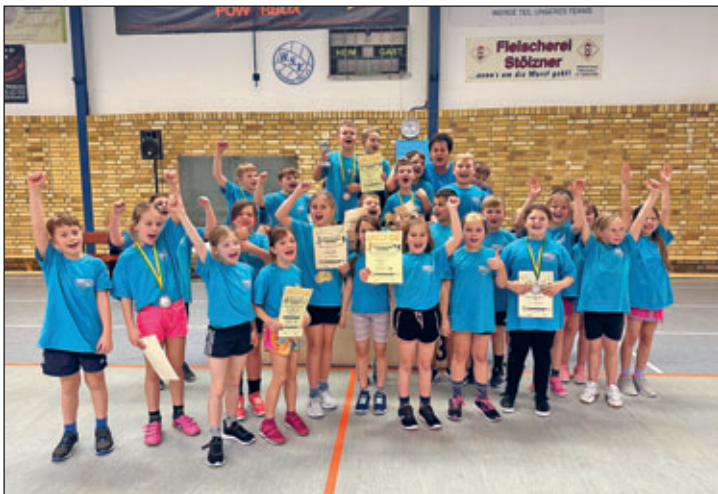
Pokalsieger „Sportlichste Klasse“ – Klasse 3 b

Bei den Mannschaftsspielen gewann die Klasse 1 b das