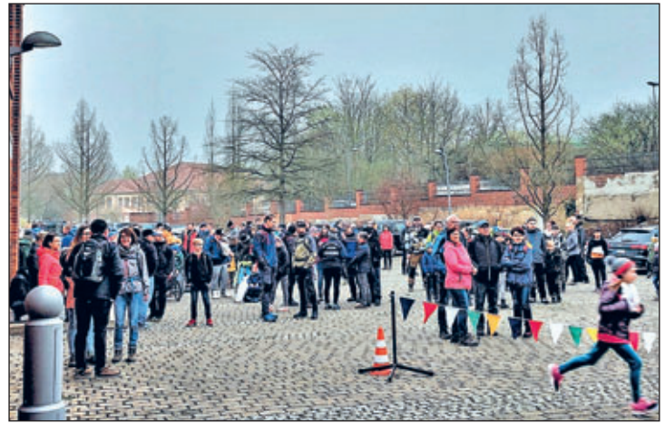
Treffpunkt 09:30 Uhr an der Ronneburger Bogenbinderhalle

Mittlerweile sind Jahrzehnte ins Land gezogen und die Osterwanderungen sind zu einer tollen Tradition, mit oftmals über 150 bis 200 Teilnehmern, in Ronneburg geworden. Und man hat vor allem Corona getrotzt, so