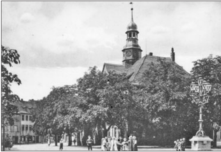
Unser Rathaus in früheren Zeiten.

So wie es heute dasteht, sehen wir es erst seit 1928/29, dem letzten großen Umbau.